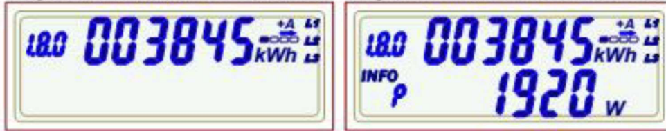
Abb. 7: Anzeige Bezugszähler ohne (links) und mit (rechts) Leistungsanzeige

Anzeige des Energiewertes und der Momentanleistung der angeschlossenen Leiter.