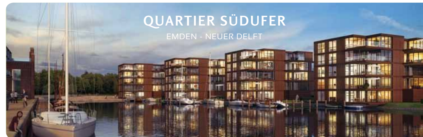
QUARTIER SÜDUFER EMDEN - NEUER DELFT

In der Seehafenstadt ist ein neues Wohngebiet entstanden.